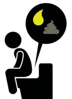
Dark urine, pale stools, diarrhea

If you think you have Hepatitis A, see your doctor or visit the closest Emergency Room. Always wash your hands with soap and water after going to the bathroom or changing diapers, and before handling food.